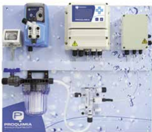
Clorimatic Aljibe Cloro

Los controladores que incorpora el panel actúan como reguladores para lograr los parámetros óptimos para el mantenimiento del cloro y pH en el aljibe, activando las bombas dosificadoras que responden según los valores prefijados por el usuario.