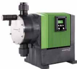
Bombas de membrana