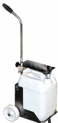
Pro fog 2B

Equipo portátil y compacto para aplicación en el ambiente de desinfectantes en frío mediante nebulización (espectro de gotas de 8 a 15 micras). No requiere instalación previa, tan sólo una toma de aire comprimido. Para automatizar los tiempos de aplicación, opcionalmente se puede suministrar equipado con un temporizador digital que controla los tiempos de aplicación del desinfectante. Se recomienda para volúmenes inferiores a 1.000m 3 .