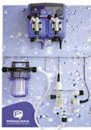
Clorimatic Aljibe Cloro-pH